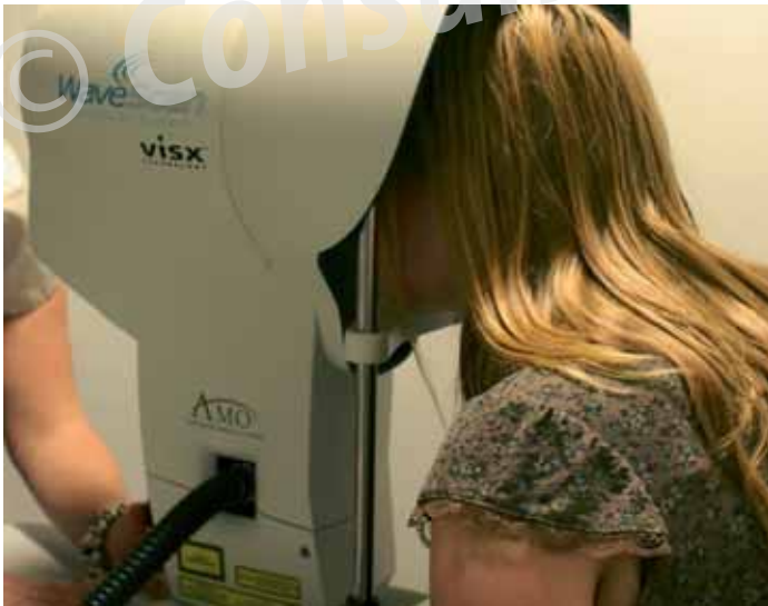
Een 'wavefront-meting' brengt specifieke oogkenmerken in kaart