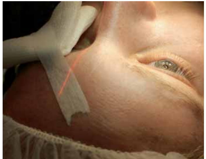
De behandeling van het rechteroog gaat beginnen