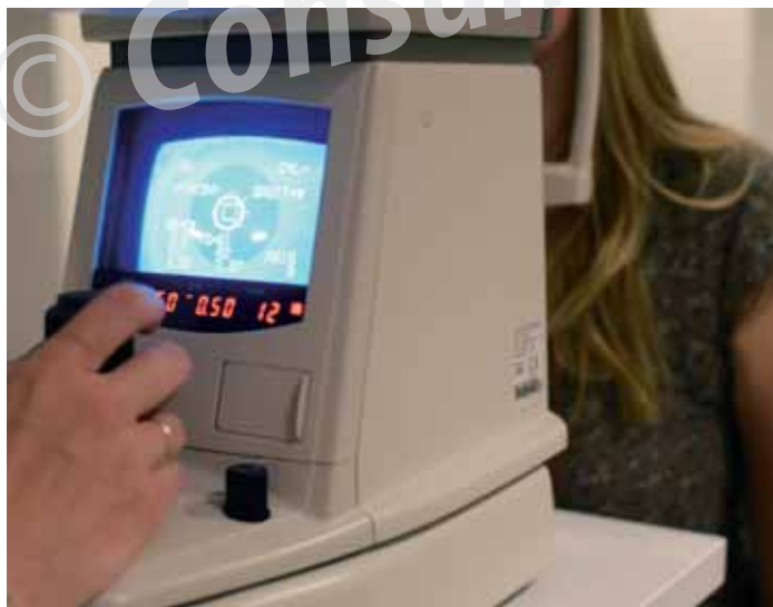
Bij het vooronderzoek wordt de oogafwijking bepaald