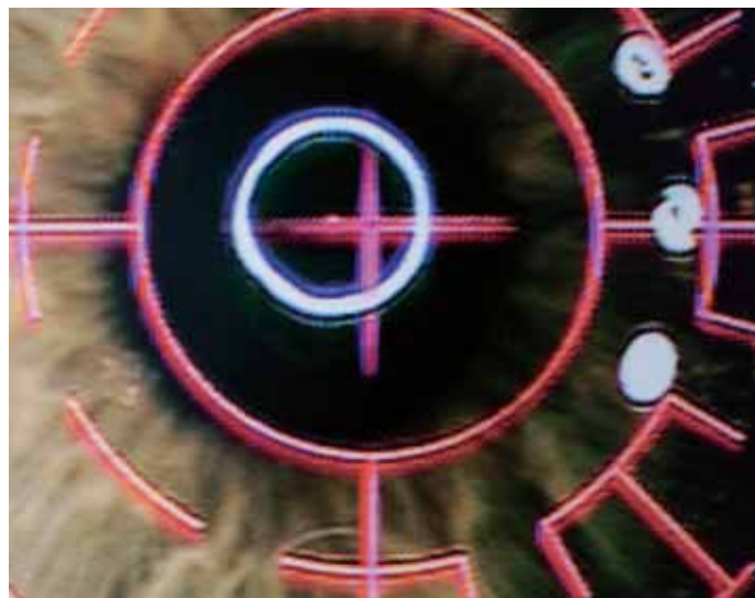
De laser wordt op het oog gericht

gang van zaken rond de operatie een rol. Alle artsen van de klinieken bleken ook buiten kantooruren direct bereikbaar voor calamiteiten, maar de manier waarop was niet altijd ideaal. Het best is het als de patiënt een gsm-nummer meekrijgt dat direct verbindt met een arts. Wie in paniek is, moet geen antwoordapparaat aan de lijn krijgen of de mededeling dat hij een ander nummer moet proberen.